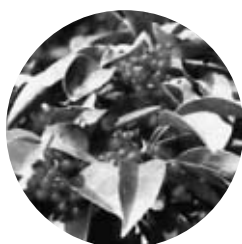
市木 クロガネモチ