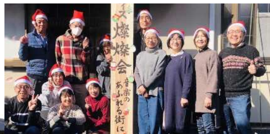
燦燦会「再来舞」コンサート 8時30分～10時30分