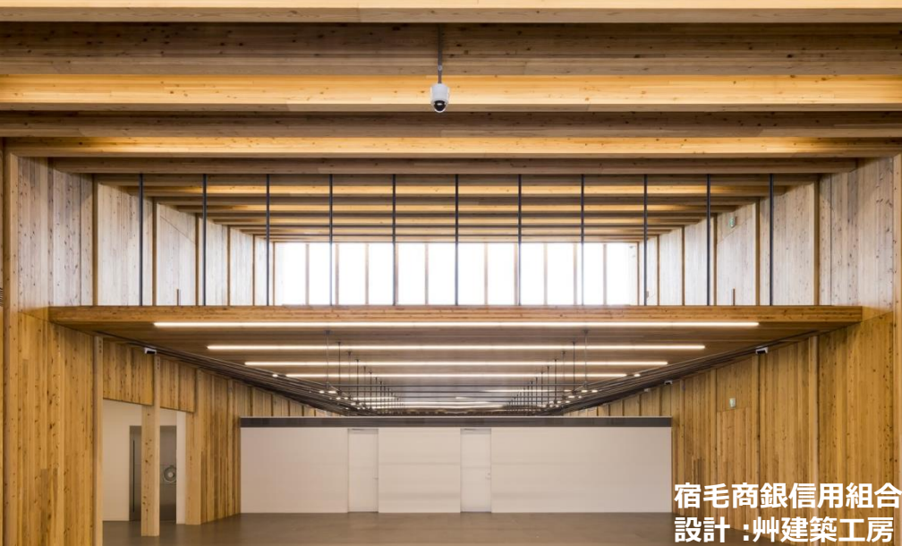
宿毛商銀信用組合 設計:艸建築工房