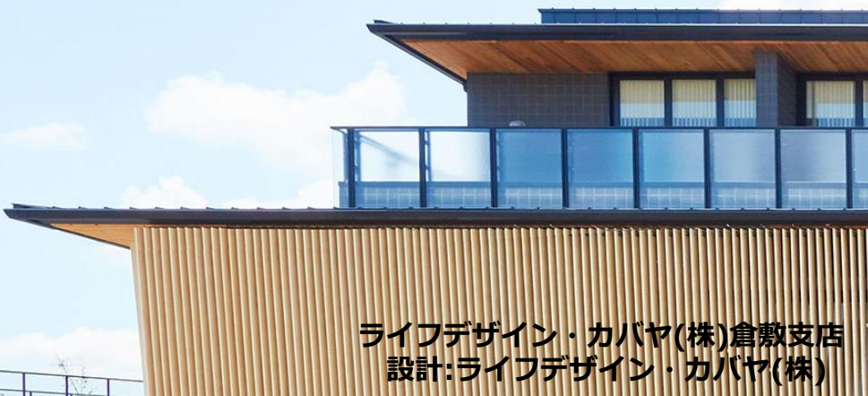
ライフデザイン・カバヤ(株)倉敷支店 設計:ライフデザイン・カバヤ(株)