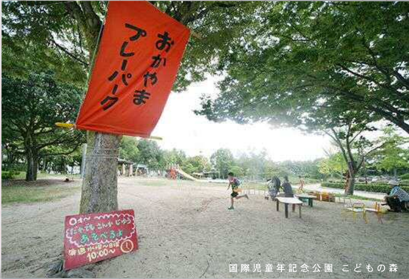
国際児童年記念公園 こどもの森